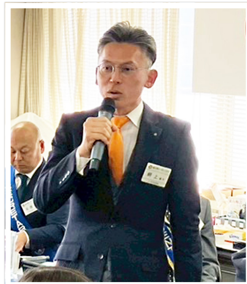
紹介者：畔上 順平 会員