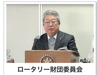
ロータリー財団委員会