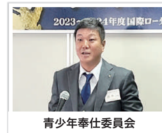
青少年奉仕委員会