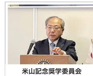
米山記念奨学委員会