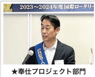
★奉仕プロジェクト部門