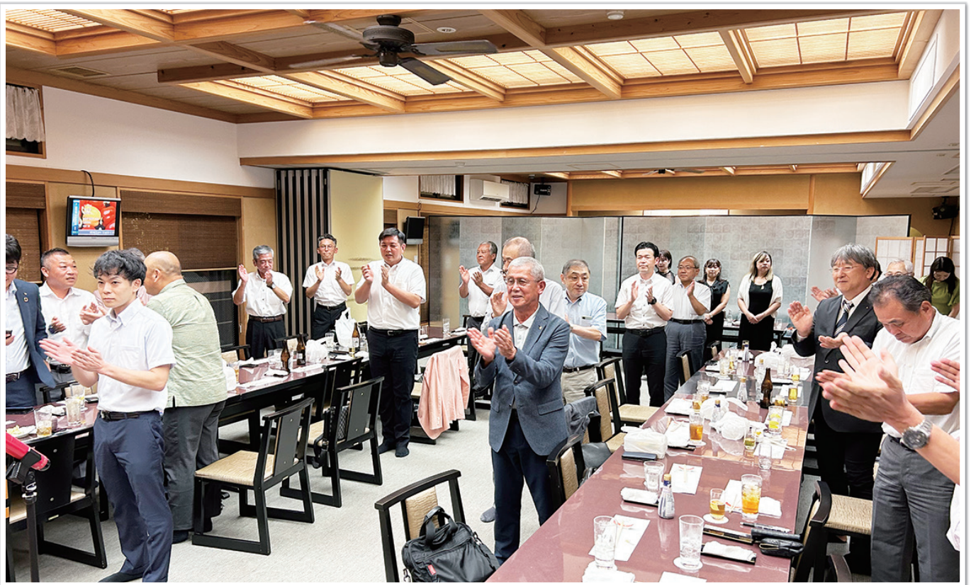
歓迎会会場の様子

分) 入行。以降、営業畑を歩み、桶川支店長、東大宮支店長、総合企画部、人事部を経て現職。趣味はドライブ（車好き）、映画鑑賞。家族は当行出身の妻と子ども4人、子供達の成長が1番の楽しみ。ロータリー例会はいつも勉強になります。奉仕の精神を身につけ、支店運営にも活かして行きたいと思いますのでどうぞよろしくお願い致します。