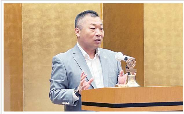
8/25に行われました会長幹事会にて伝えられたことを報告させていただきます。